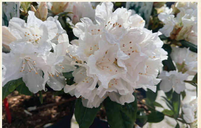
Rhododendron (Y) , 'Dora Amateis'