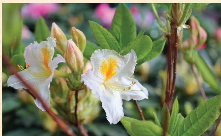
Azalea (KH), Möwe'